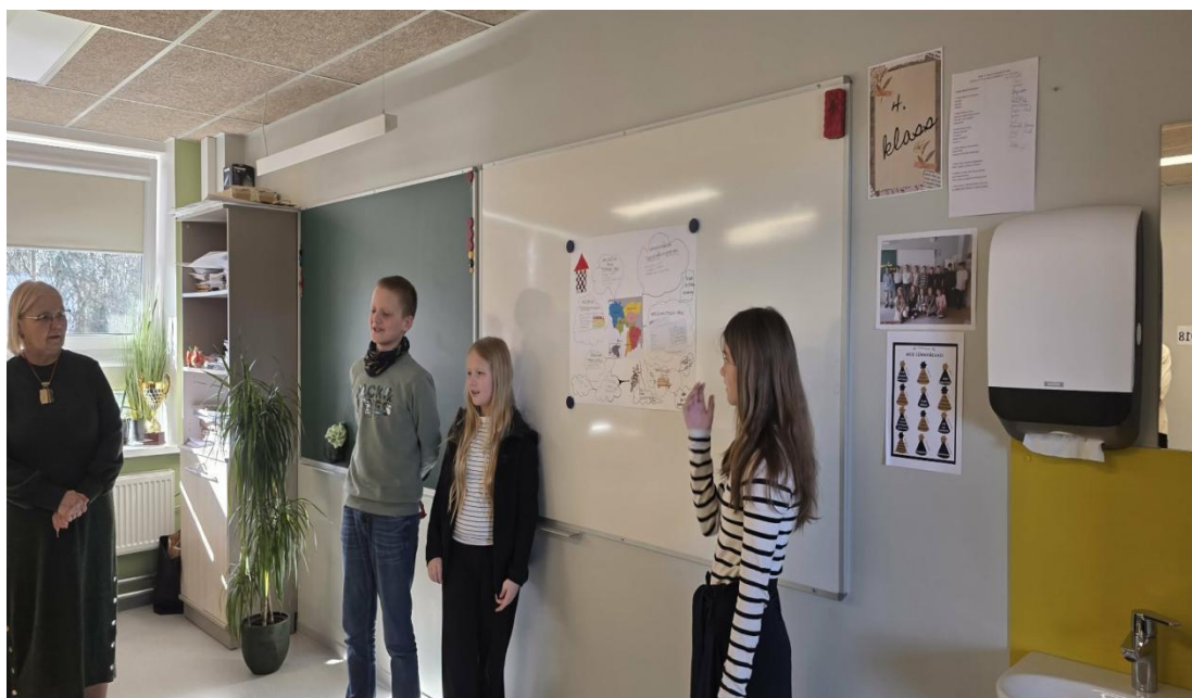
Rühm reisiplaani tutvustamas.

8.–9. klassi päeva alustas õpetaja Elo eneseanalüüsi töötuba „Minu tulevik algab minu olevikust“. Lisaks tutvustati õppimisvõimalusi Luua Metsanduskoolis ning tegeleti praktilisema osaga. Näiteks õpiti puude kõrgust mõõtma, määrati puuliike ning pidi ära tunda loomanahku.