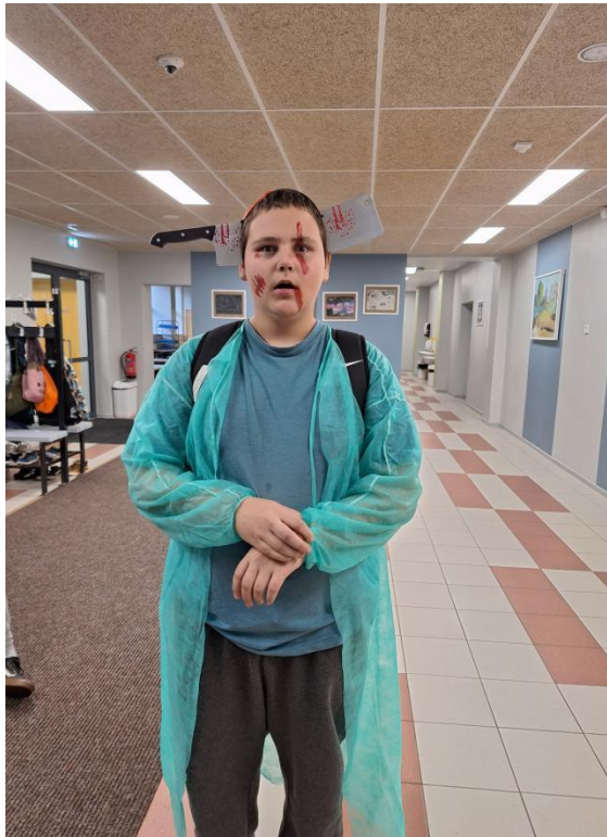
Stiilin ä dal 2023