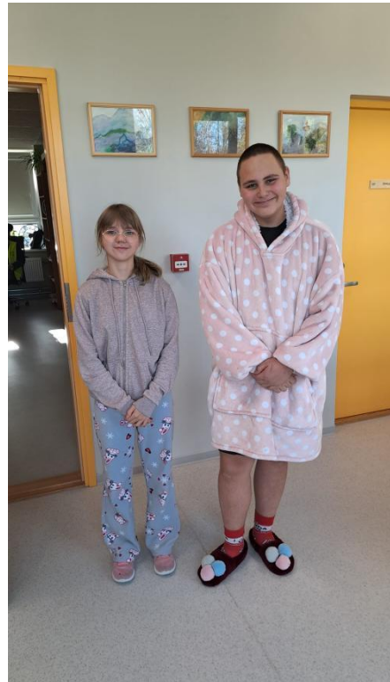
Tuduriiete p ä ev 2024